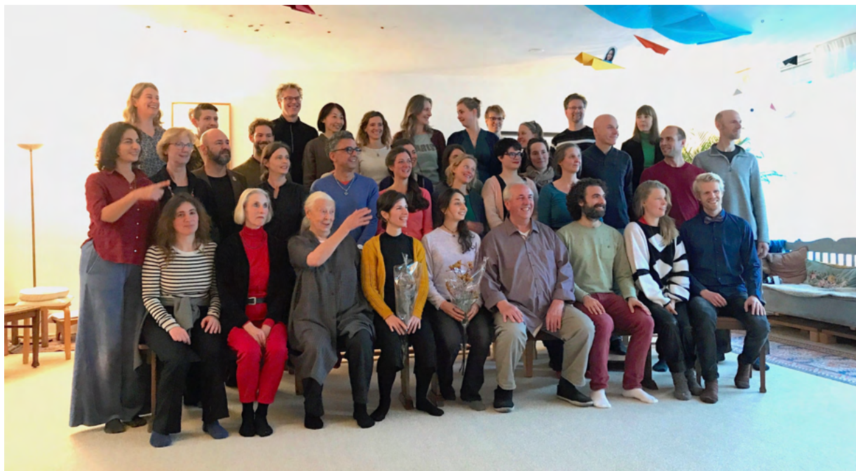
Studenten en leraren 2019