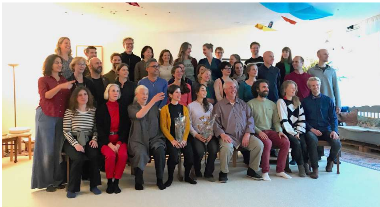
Studenten en leraren 2019